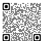
QRコード 四日市市文化会館ホームページ

〔ただし例外あり：人形劇はチケット販売(四日市市三浜文化会館窓口・四日市市文化会館窓口・インターネットにて10月16日(土)より発売します) 写真展は無料鑑賞、ロビーコンサートについては先着順となります〕