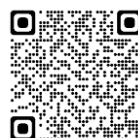
QRコード 四日市市三浜文化会館ホームページ

応募方法その他公演詳細につきましては、四日市市文化会館または三浜文化会館ホームページをご覧ください。