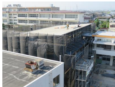
建設中の西側 B 棟

現在、くす南・くす北保育園及び楠南・楠北幼稚園の四園を一園化する「(仮称)楠こども園」は、令和3年4月開園を目指して工事が進められています。旧楠北幼稚園の敷地内では工事車両や作業員さんが建設音を響かせて連日作業を行っている事で、工事も順調に進んでいます。右写真のように、7月には西側B棟、8月には東側A棟の骨格が出来上がってきました。保育園、幼稚園の良い所を連携させた新園舎として完成するのを、日々楽しみに眺めています。