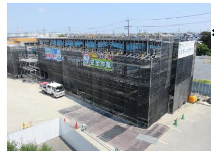
建設中の東側 A 棟