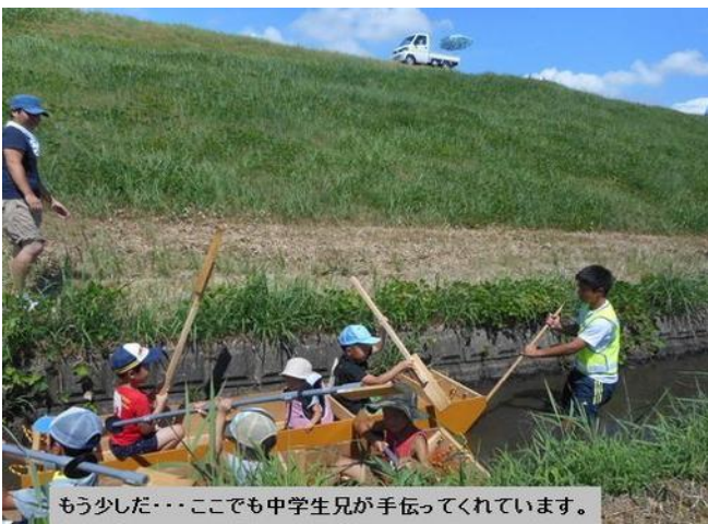
もう少しだ・・・ここでも中学生兄が手伝ってくれています。