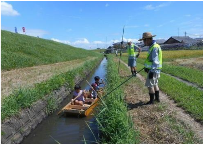
お姉さんはしっかり舵を取っているのですが、苦戦しています。