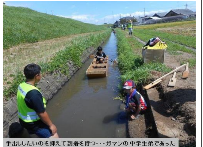
手出ししたいのを抑えて到着を待つ・・・ガマンの中学生弟であった