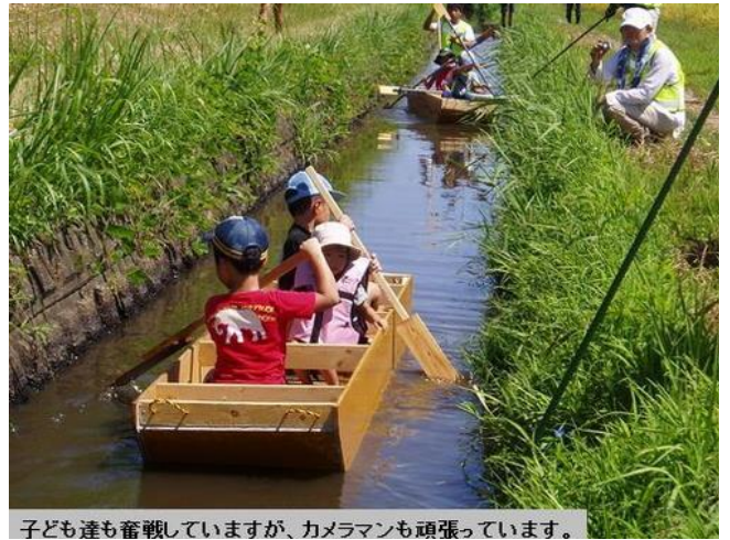
子ども達も奮戦していますが、カメラマンも頑張っています。