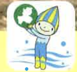
清流ミナモの未来づくり登録事業

吉崎海岸ではNPO法人四日市ウミガメ保存会が「ウミガメのふるさと四日市」をスローガンに2009年1月から吉崎海岸で毎月海岸清掃や自然に関する勉強会を行っています。私たちも吉崎海岸の活動や意見交換を通じて、伊勢湾流域の環境を考え豊かな伊勢湾を実現する活動を進めていきましょう。