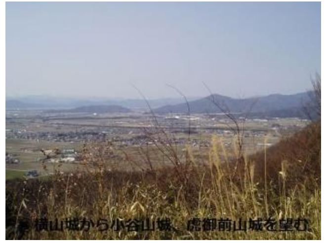
④ 横山城から小谷山城、虎御前山城を望む