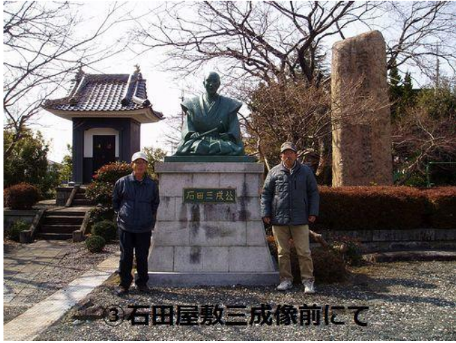
③ 石田屋敷三成像前にて