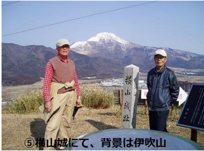
⑤ 横山城にて、背景は伊吹山