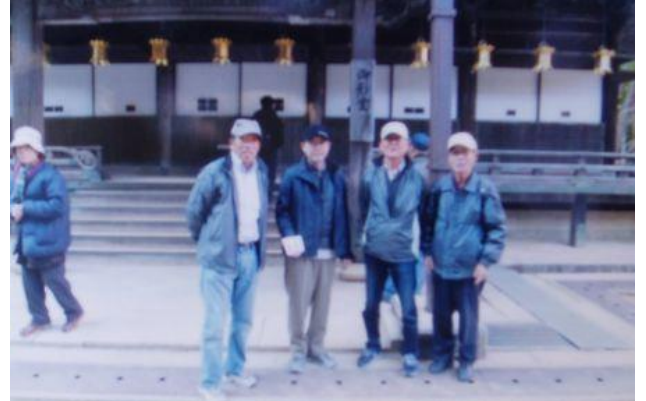
弘法大師の御影が祀られている御影堂前にて神妙な4人