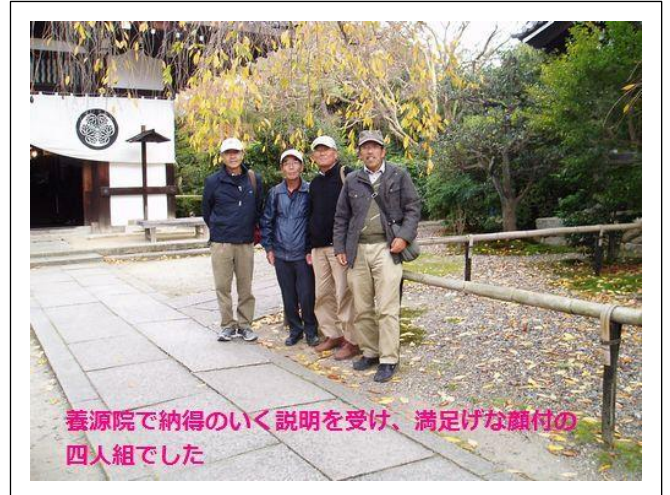
養源院で納得のいく説明を受け、満足げな顔付の 四人組でした