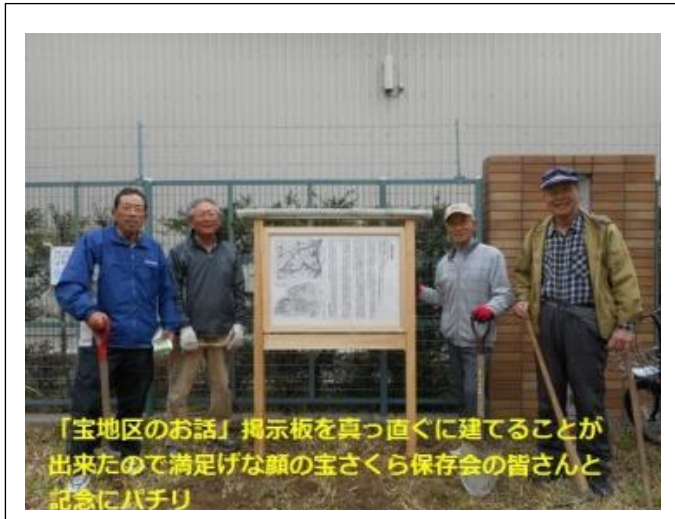
「宝地区のお話」 掲示板を真っ直ぐに建てるのが出来たので満足げな顔の宝さくら保存会の皆さんと記念にパチリ