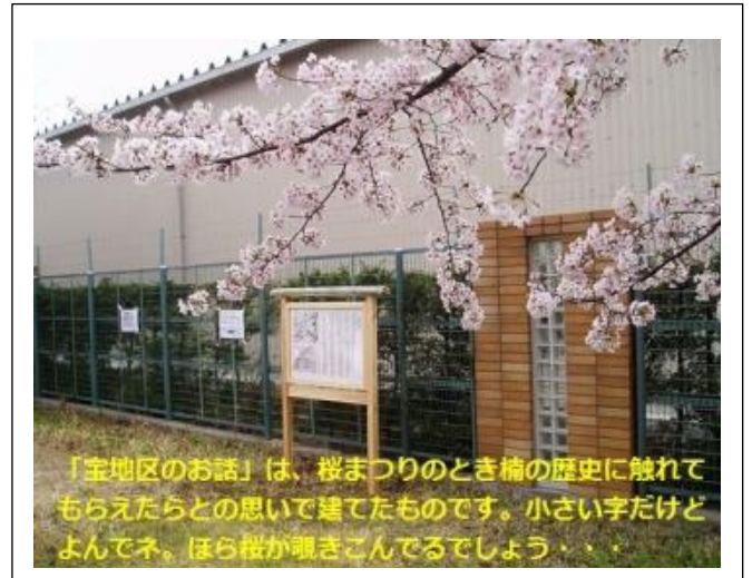
「宝地区のお話」は、桜まつりのとき楡の歴史に触れてもらえたらとの思いで建てたものです。小さい字だけどよんでネ。ほら桜が覗きこんでるでしょう・・・