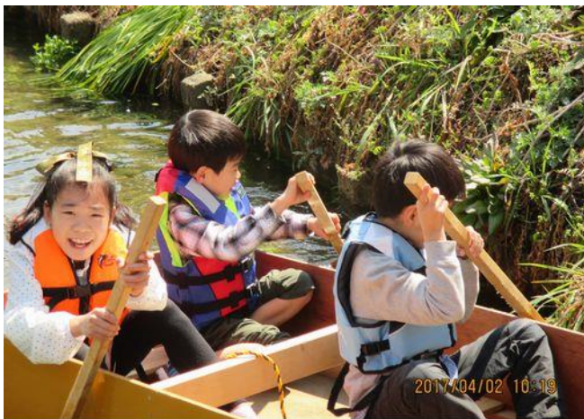
たんけん員はこの笑顔を見るために頑張っているのですね。笑顔ありがとう！