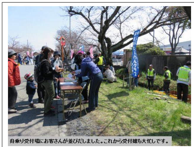
舟乗り受付場にお客さんが並びました。これから受付嬢も大忙しです。