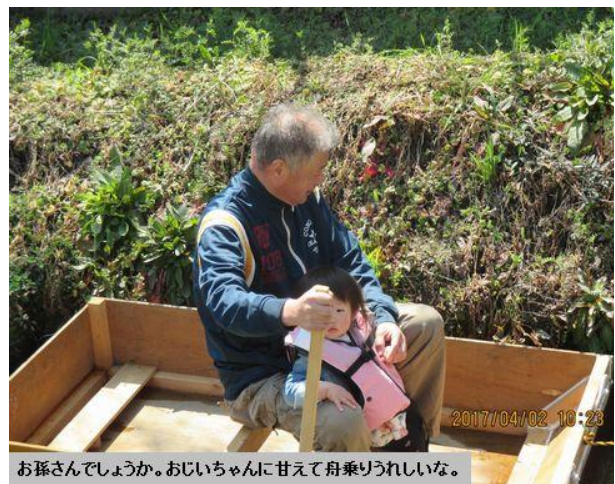
お孫さんでしょうか。おじいちゃんに甘えて舟乗りうれしいな。