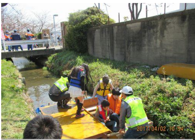
こちらは4人乗りで出港です。たんけん員は長靴に水が入るのもかまわず安全確保。