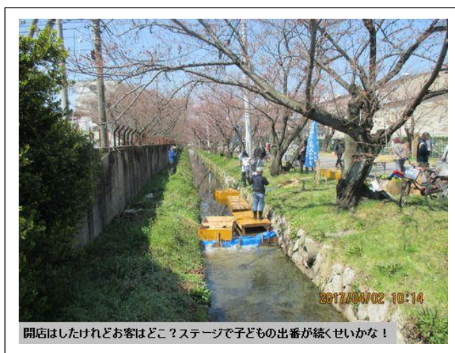
開店はしたけれどお客はどこ? ステージで子どもの出番が続くせいな!