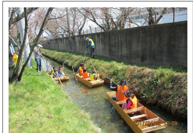
こちらは上手に整列して行きかいですね。だいぶん腕が上がってきました！。