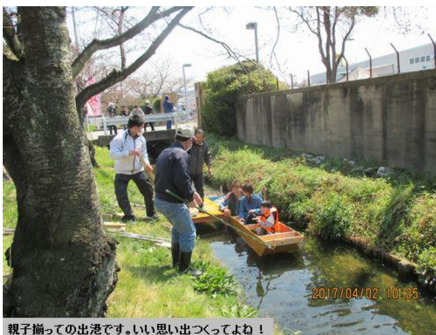
親子揃っての出港です。いい思い出つくてよね！