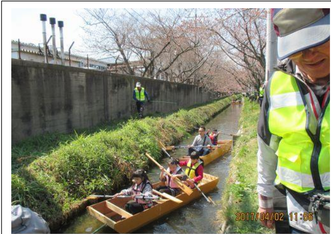
渋滞解除で舟が進みましたね。三人組の女の子の櫂の形がさまになっていますね。