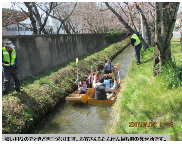
狭い川なのでときどきこうなります。お客さんもたんけん員も腕の見せ所です。