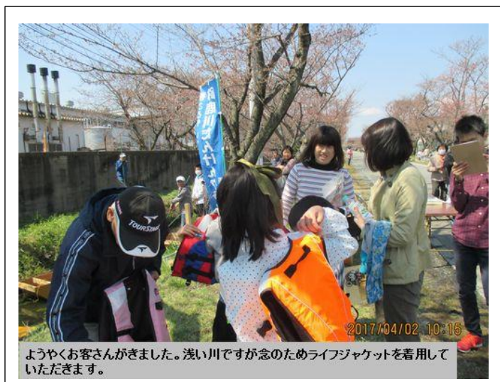
ようやくお客さんがきました。浅い川ですが念のためライフジャケットを着用していただきます。