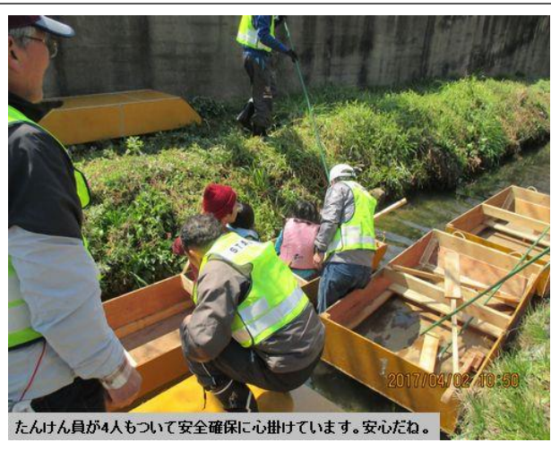
たんけん員が4人もついて安全確保に心掛けています。安心だね。