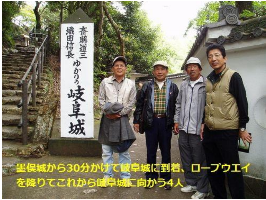
墨俣城から30分かけて岐阜城に到着、ロープウェイを降りてこれから岐阜城に向かう4人