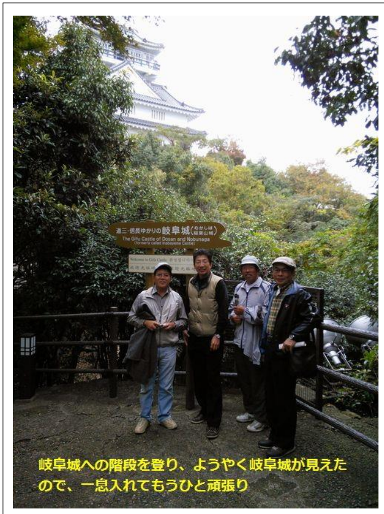
岐阜城への階段を登り、ようやく岐阜城が見えたので、一息入れてもうひと頑張り