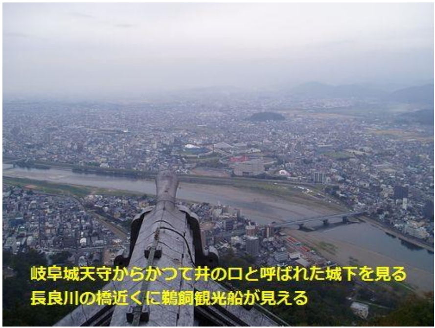
岐阜城天守からかつて井の口と呼ばれた城下を見る 長良川の橋近くに鶺鴒観光船が見える