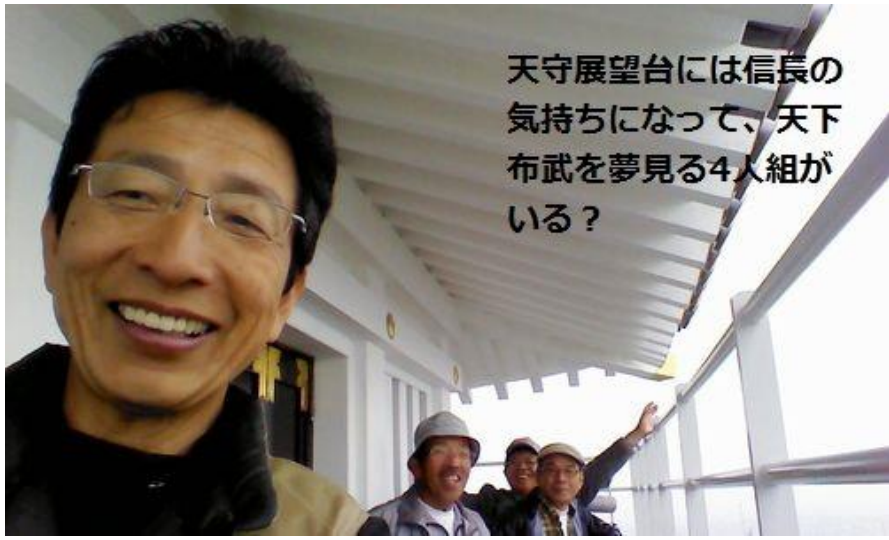
天守展望台には信長の 気持ちになって、天下 布武を夢見る4人組が いる？