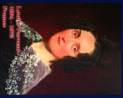
Louise Farrenc 1804 - 1875 France