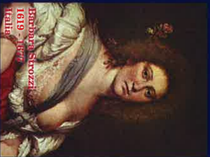
Barbara Strozzi 1619 - 1677 Italia