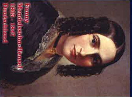
Fanny Mendelssohn-Bartholdy 1805 - 1847 Deutschland