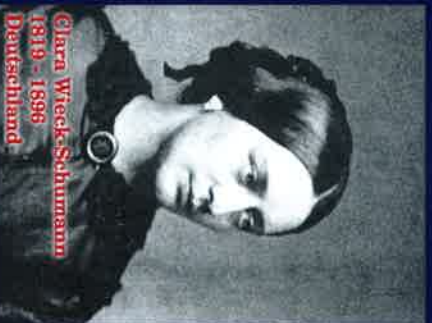
Clara Wieck-Schumann 1819 - 1896 Deutschland