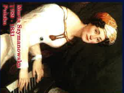
Maria Szymanowska 1788 - 1831 Polen